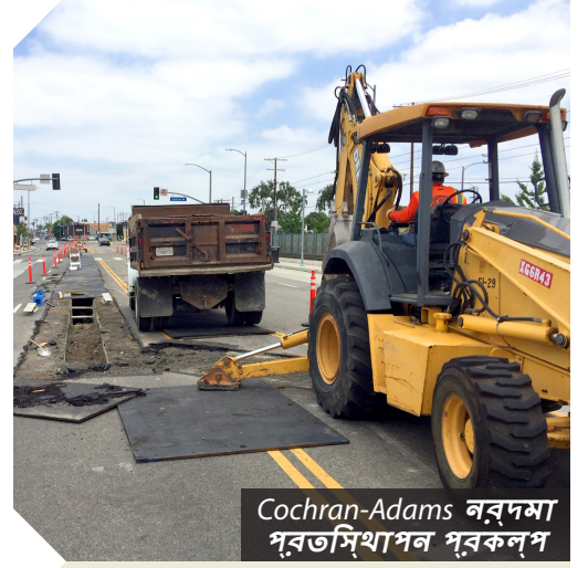
Cochran-Adams নর্দমা প্রতিস্থাপন প্রকল্প