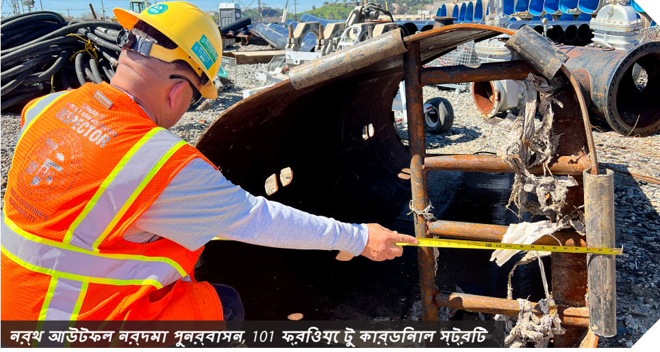
নর্থ আউটফল নর্দমা পুনর্বাসন, 101 ফরগিথ টু কার্ডিনাল স্ট্রিট