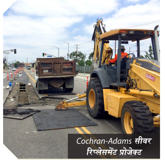
Cochran-Adams सीवर रिप्लेसमेंट प्रोजेक्ट