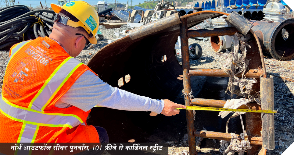
नॉर्थ आउटफॉल सीवर पुनर्वास, 101 फ्रीवे से कार्डिनल स्ट्रीट