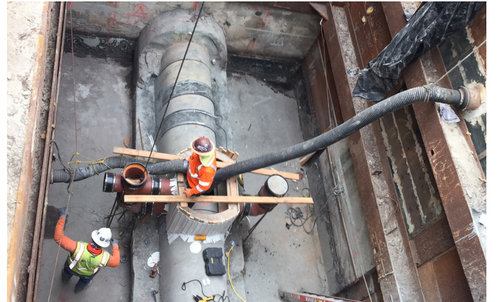
নর্থ আউটফল সুয়ারের রিহাবিলিটেশন

অতিমারীর কারণে 2020 সালে সুয়ার সার্ভিস চার্জের রেটের স্থির বৃদ্ধি স্থগিত করা হয়েছিল। LA -এর জনস্বাস্থ্য ও পরিবেশ রক্ষা করের এমন অবকাঠামোগত প্রকল্পগুলিতে বিনিয়োগ করতে 2024 সালের শরতের শুরু থেকে ধীরে ধীরে রেট বৃদ্ধি অত্যন্ত প্রয়োজনীয়।