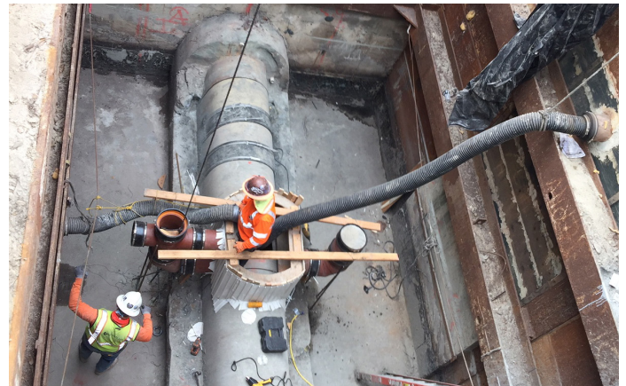
Rehabilitación del desagüe de alcantarillado del norte

Los aumentos constantes de las tasas del servicio de alcantarillado se interrumpieron en 2020 debido a la pandemia. Los aumentos graduales de las tarifas a partir del otoño de 2024 son críticamente necesarios para que LA invierta en proyectos de infraestructura que protejan la salud pública y el medio ambiente.