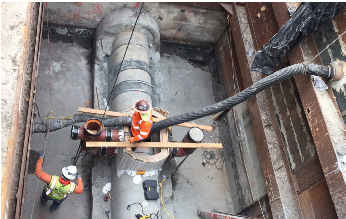
بازسازی فاضلاب خروجی شمالی

افزایش تدریجی نرخ‌های خدمات فاضلاب به دلیل همه‌گیری کرونا در سال 2020 متوقف شد. افزایش تدریجی نرخ‌های خدمات فاضلاب که از پاییز 2024 آغاز می‌شود، برای لس‌آنجلس بسیار ضروری است تا بتواند روی پروژه‌های زیرساختی که از سلامت عمومی و محیط زیست محافظت می‌کنند، سرمایه‌گذاری کند.