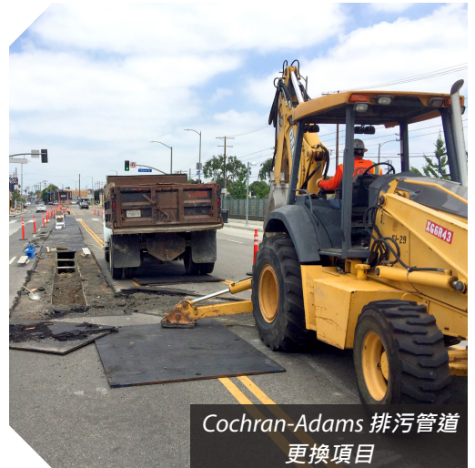
Cochran-Adams 排污管道 更換項目