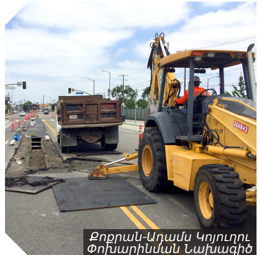
Քորրան-Ադամս Կոյուղու Փոխարինման Նախագիծ