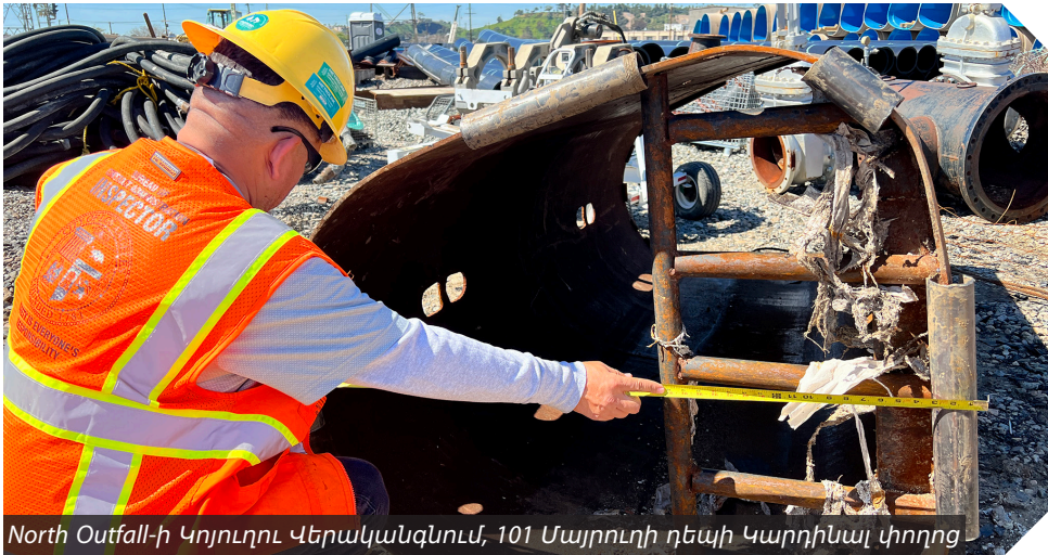
North Outfall-ի Կոյուղու Վերականգնում, 101 Մայրուղի դեպի Կարդինալ փողոց