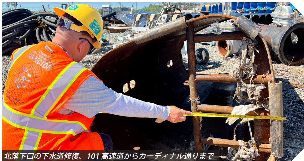
北落下口の下水道修復、101 高速道からカーディナル通りまで