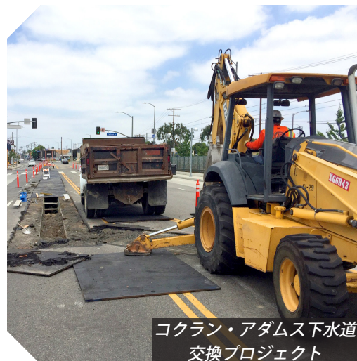
コクラン・アダムス下水道交換プロジェクト