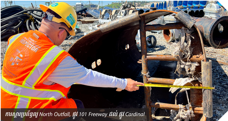
ការស្តារប្រព័ន្ធលូ North Outfall, ផ្លូវ 101 Freeway ដល់ ផ្លូវ Cardinal