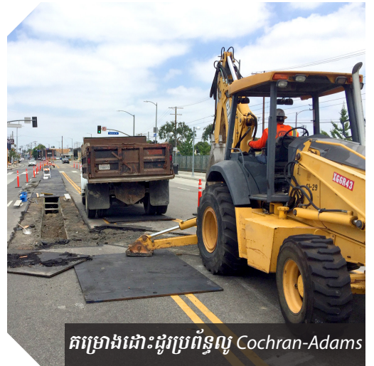
គម្រោងដោះដូរប្រព័ន្ធលូ Cochran-Adams