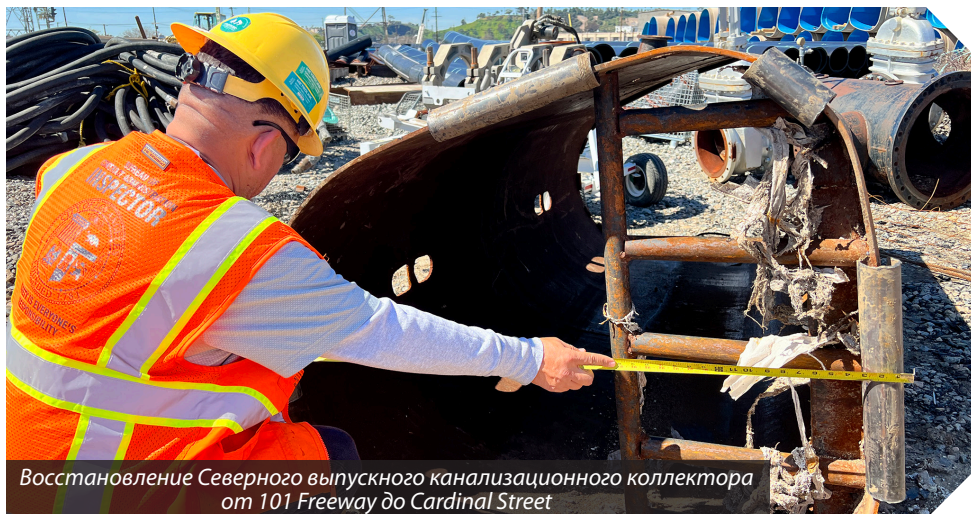
Восстановление Северного выпускного канализационного коллектора от 101 Freeway до Cardinal Street