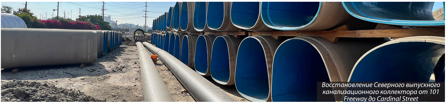
Восстановление Северного выпускного канализационного коллектора от 101 Freeway до Cardinal Street