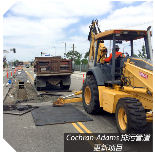
Cochran-Adams 排污管道更新项目