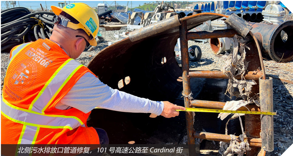
北侧污水排放口管道修复，101号高速公路至 Cardinal 街