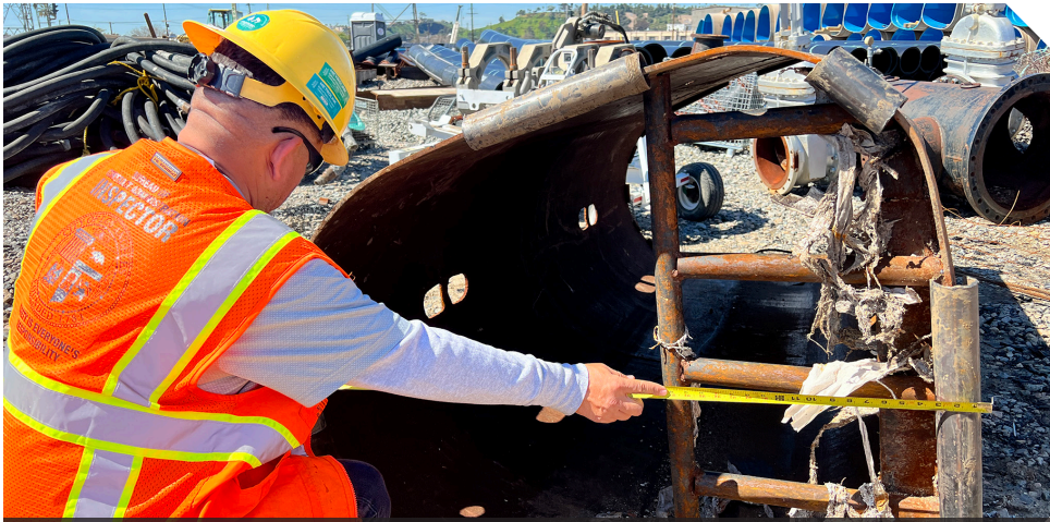
Reacondicionamiento del alcantarillado de la desembocadura norte, Autopista 101 a Cardinal Street