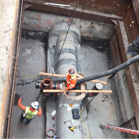
Reacondicionamiento del alcantarillado de la desembocadura norte