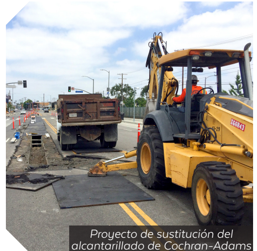
Proyecto de sustitución del alcantarillado de Cochran-Adams