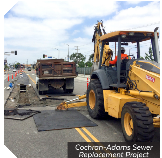
Cochran-Adams Sewer Replacement Project