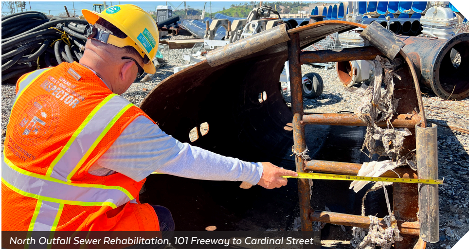
North Outfall Sewer Rehabilitation, 101 Freeway to Cardinal Street