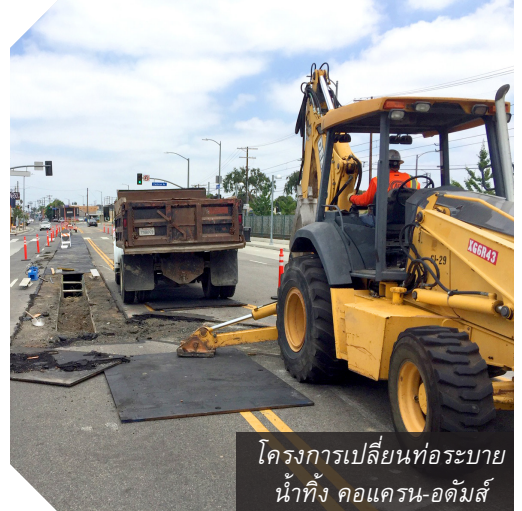
โครงการเปลี่ยนท่อระบายน้ำที่ คอแตรน-อดัมส์