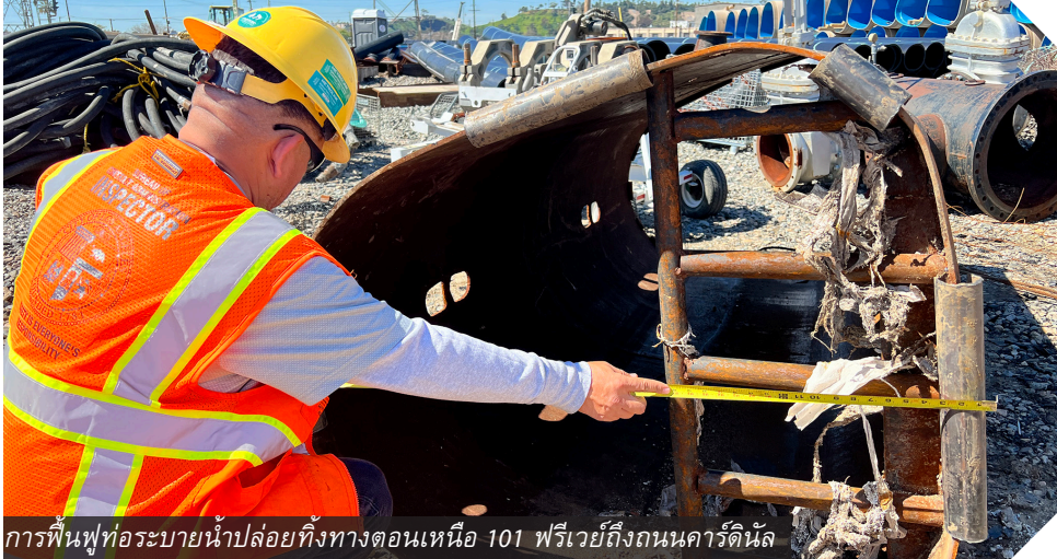
การฟื้นฟูท่อระบายน้ำปล่อยทิ้งทางตอนเหนือ 101 ฟริเวย์ถึงถนนคาร์ดินัล