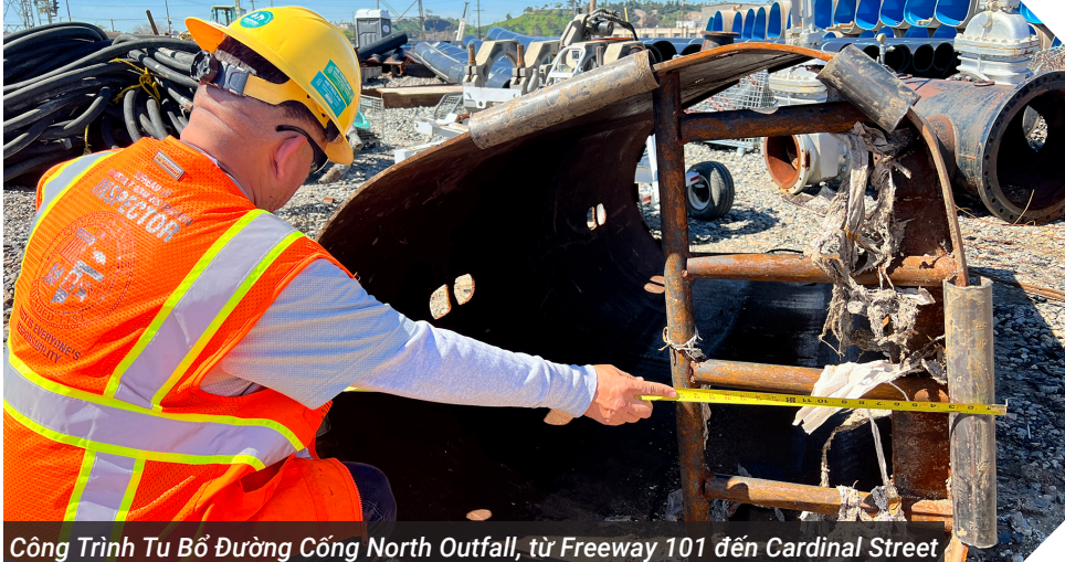
Công Trình Tu Bổ Đường Cống North Outfall, từ Freeway 101 đến Cardinal Street