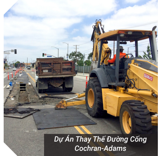
Dự Án Thay Thế Đường Cống Cochran-Adams